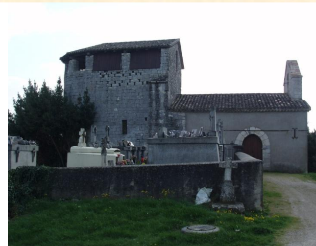
L'église de Bruguières (P-J)

A COLLECTION COMMUNALE déposée aux AD , numérisée 2NUM 67, 74, 75 et 90 et B COLLECTION DEPARTEMENTALE