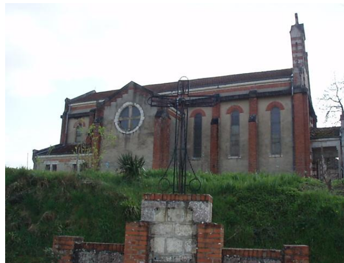
L'église de Mazères (P-J)