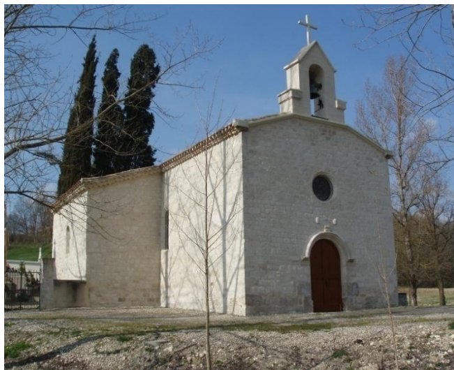
L'église de Canhac(P-J)