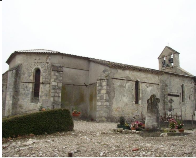
la chapelle St Pierre de Cazillac (P-J)