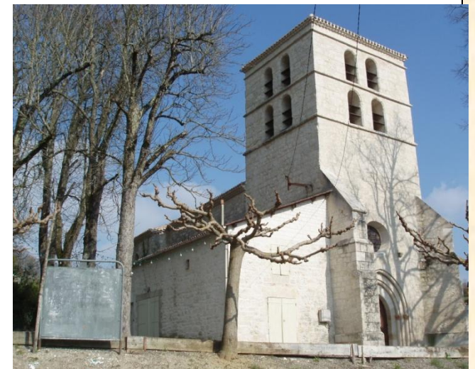
L'église de Tissac(P-J)