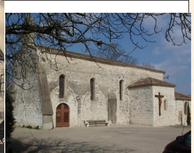
L'église de Martissan (P-J)