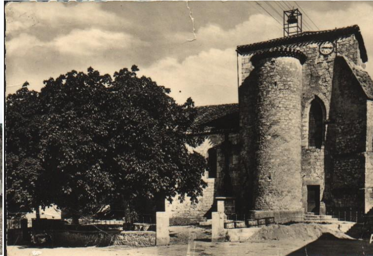
L'église de Cazes