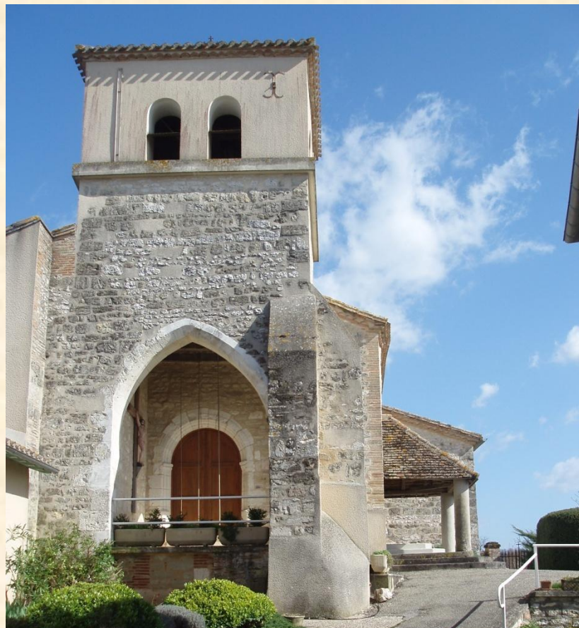
Eglise de Montfermier (P-J)

120 hab (1990) 18 hab/km 2 superficie 6,5 km 2 Diocèse : Cahors - Sénéchaussée : Montauban Canton : Montpezat-de-Quercy