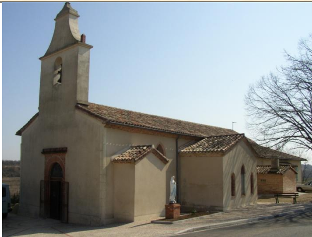
L'église de St Romain (P-J)

544 hab (1990) 20 hab/km 2 superficie 27,5 km 2 Diocèse : Cahors - Sénéchaussée : Montauban Canton : Molières