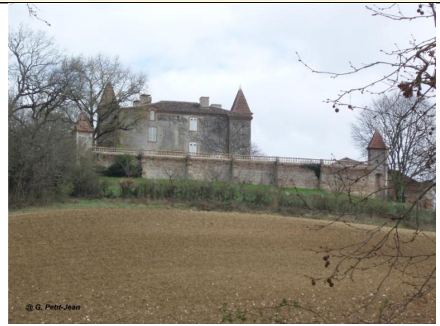
Château de Lisle (P-J)