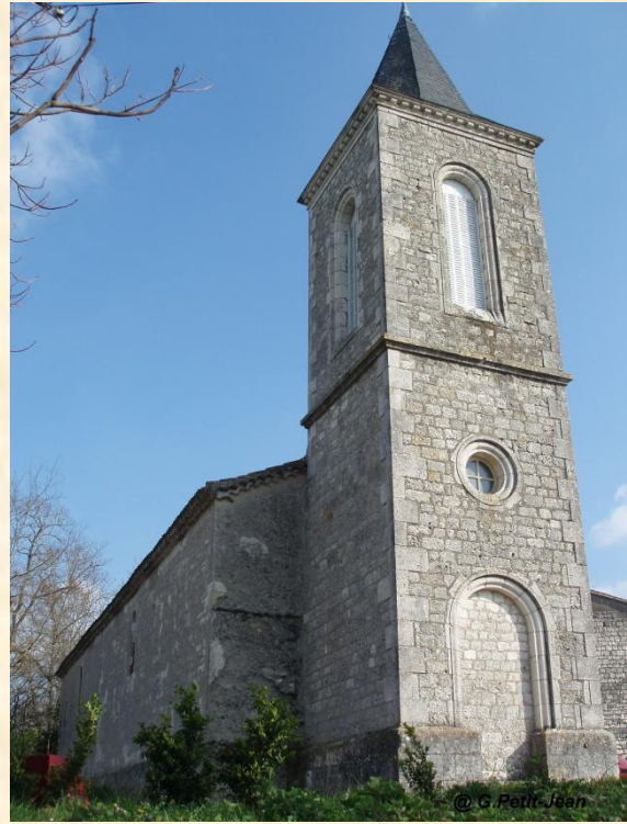
Eglise de Sauveterre (P-J)