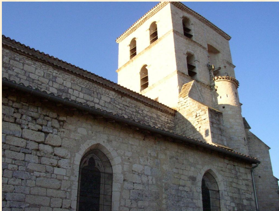
Eglise Saint Julien de Vazerac